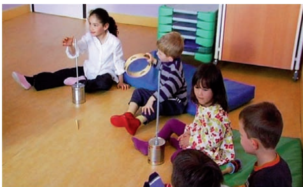
© Les films après la pluie