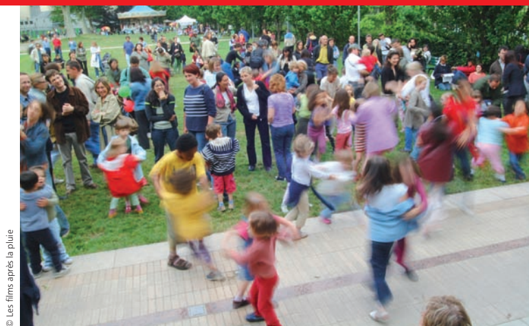
© Les films après la pluie